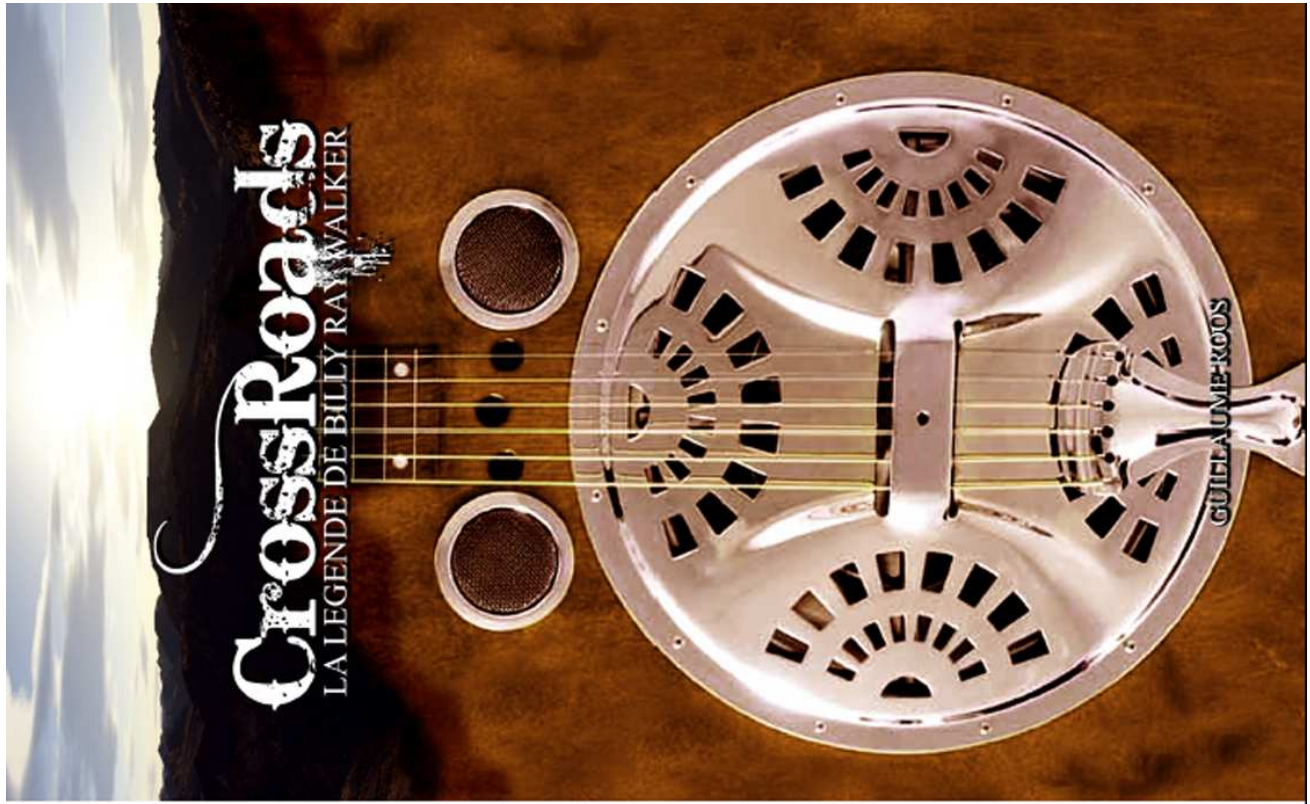
Crossroads : La légende de Billy Ray Walker